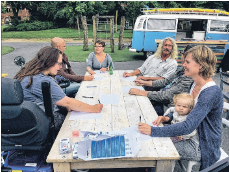
Bezoekers met elkaar in gesprek op JOP-terrein tijdens informatiebijeenkomst.

omdat dit een belangrijk onderdeel is van de coöperatieve wijkraad: verschillende mensen met elkaar in gesprek brengen die normaal weinig of niet met elkaar spreken."