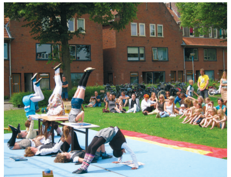
■ Kindercircus Santelli had aan publiek geen gebrek.