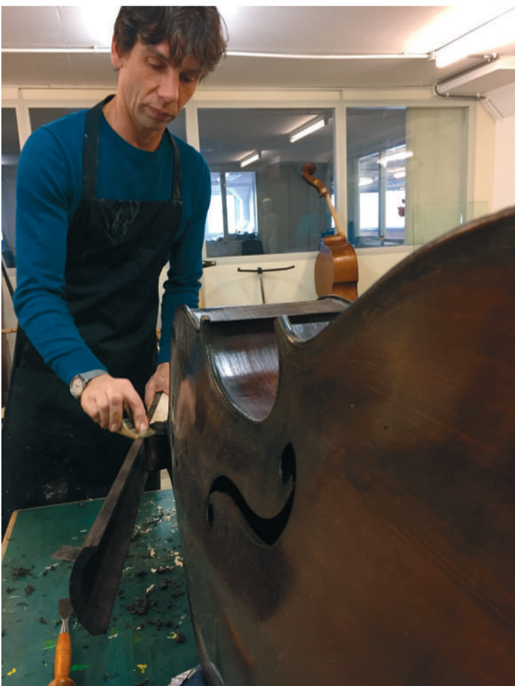
■ Restauratie van een contrabas.