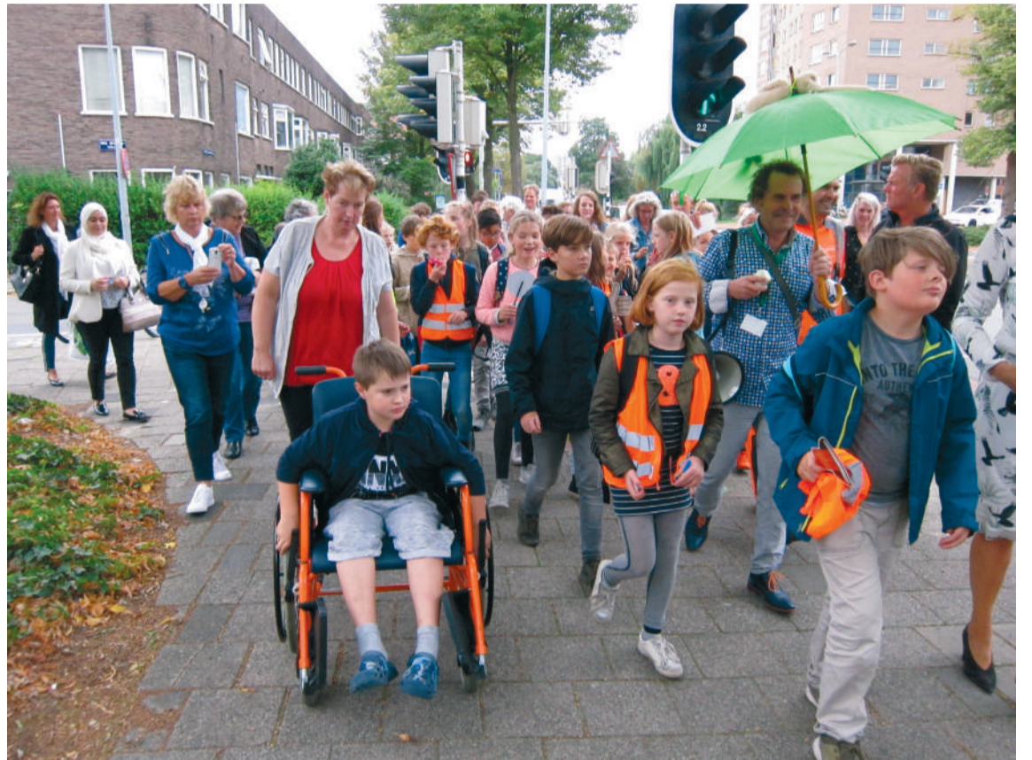
■ Het gezelschap ging met gezang en getoeter van steen naar steen.