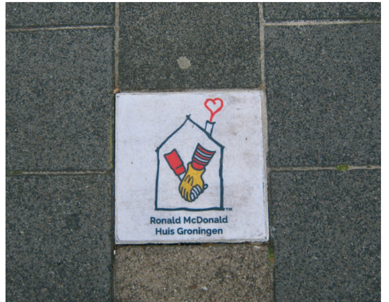
■ Deze stenen zijn tussen het UMCG en het Kooykerplein te vinden in het trottoir.

Daarmee was het officiële gedeelte van de opening van de route ten einde. Maar het feest was nu nog niet afgelopen. Op het dakterras van het Ronald McDonald Huis werden alle kinderen getraakteerd op poffertjes en limonade. De poffertjes werden ter plaatse door twee koks bereid. Het was de smakelijke afsluiting van een vrolijke en kleurrijke middag.