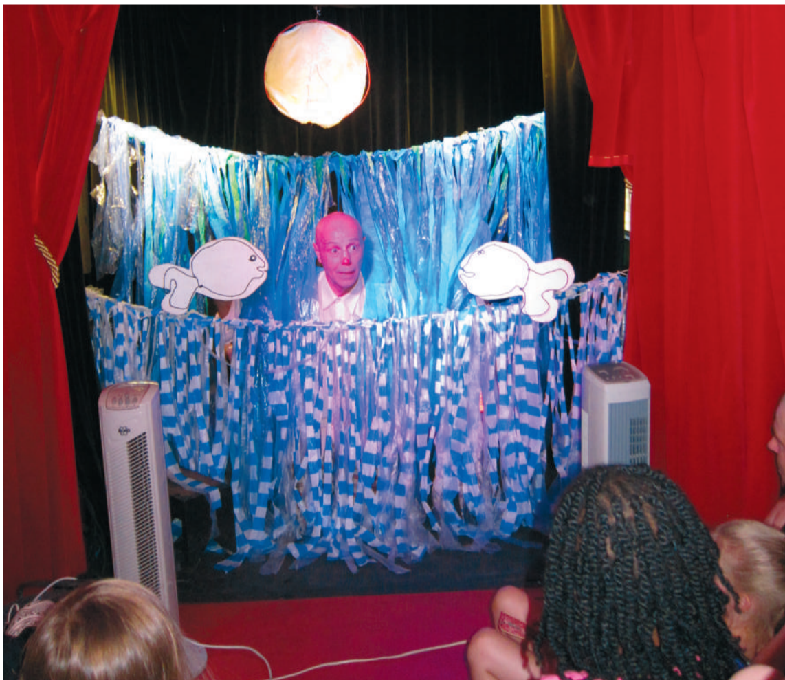
■ Avonturen op zee, verbeeld door lange, blauwe, omlaag hangende linten.

bouwpakket een klein model van de busganga te knippen en te plakken. Tot het voor hem tijd werd om op te stappen. Over een klein half uur begon de volgende voorstelling.