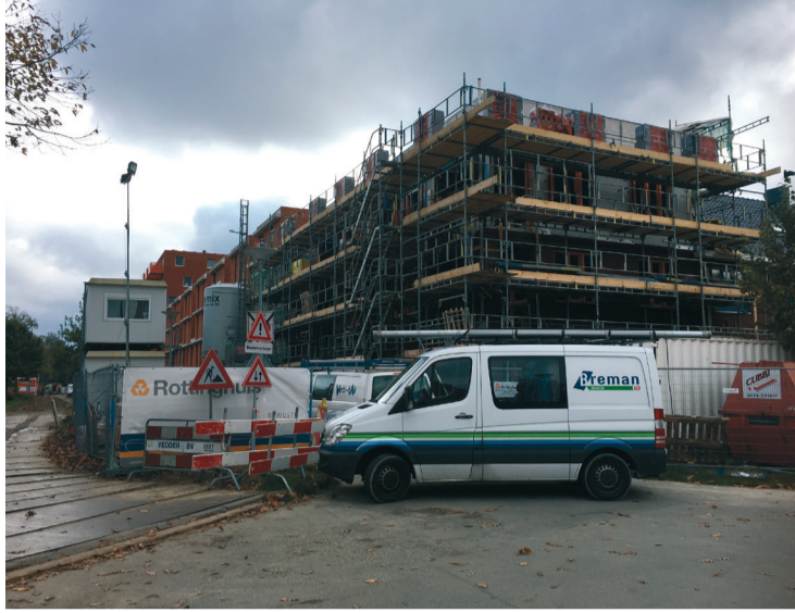
2. Deze nieuwbouw lijkt maar te duren en te duren.