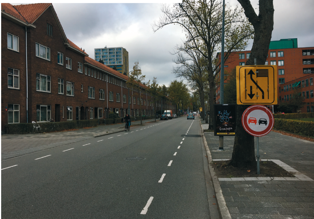
6. Moet ook op de schop, maar wat en hoe precies kun je nog niet zien.