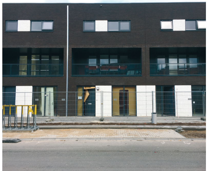
7. Naast de huizen in lichtbruin nu nieuwbouw met donkerbruin en wit als kleurencombinatie.