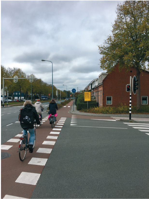
1. Dit fietspad gaat binnenkort op de schop.