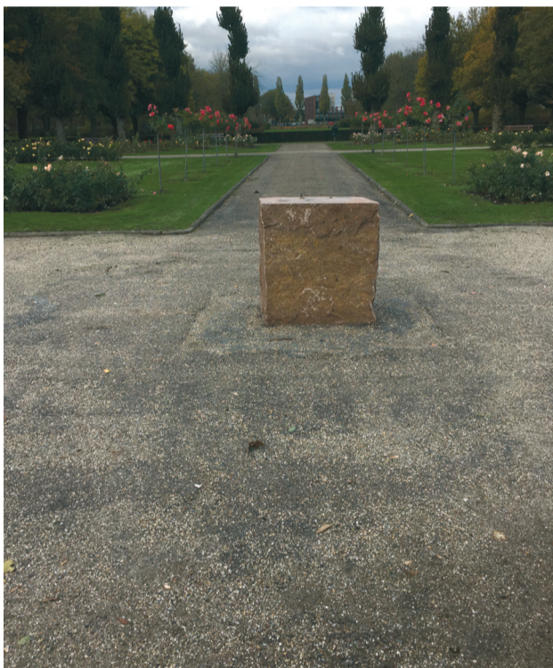
4. Beeld is ook in onderhoud, maar dat kon niet ter plaatse.