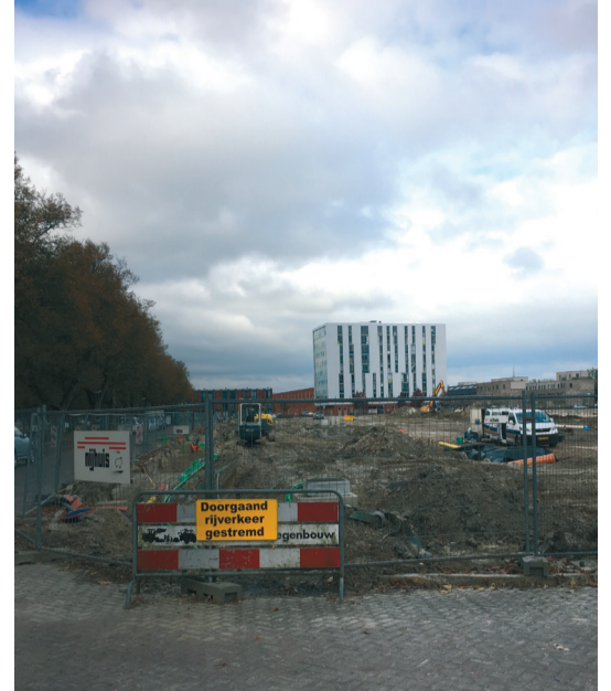
3. Net bouwrijp aan het worden, duurt nog wel een jaartje voordat hier wat staat.”