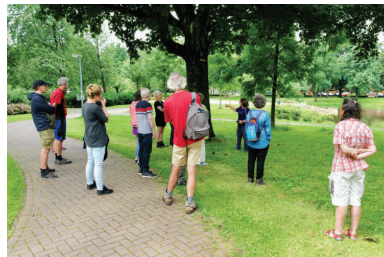
Hilly bij de vleermuiskast.

vormen bessen en die bessen zitten eraan in maart en april, en dat is ook weer een periode dat er nauwelijks vruchten zijn, dus dat is heel mooi voor vruchtetende vogels, de merels,