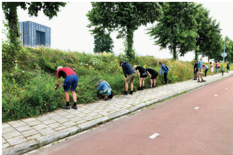
Insectentelling bij het Damsterpad.