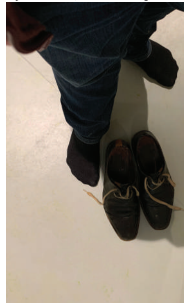
Slofje om of op kousevoeten door de nieuwe school. Daar moet iedereen zich aan houden.