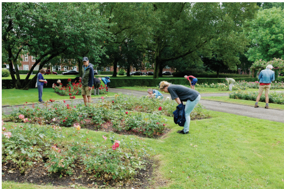
Insectentelling in het Rosarium.

De tweede Natuurwandeling (met andere onderwerpen) vindt plaats op zondag 26 september, 10.00 uur. Aanmelden: Het Oude Politiebureau, tel. 050-2113684.