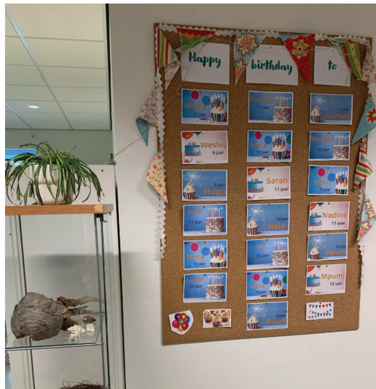
Iedereen die jarig is hangt met de voornaam op een groot prikbord.

meer zicht op te geven komt in de volgende wijkkrant een verslag van een interview over hoe een school met zoveel mogelijkheden en vrijheden, haar regels om fijn samen te leren opstelt en uitdraagt.