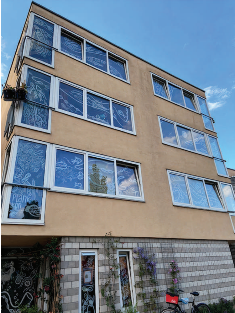
Plankton overal. Ook bij de burens! Kunstenaar Pieter van Dijken in de Slachthuisstraat.