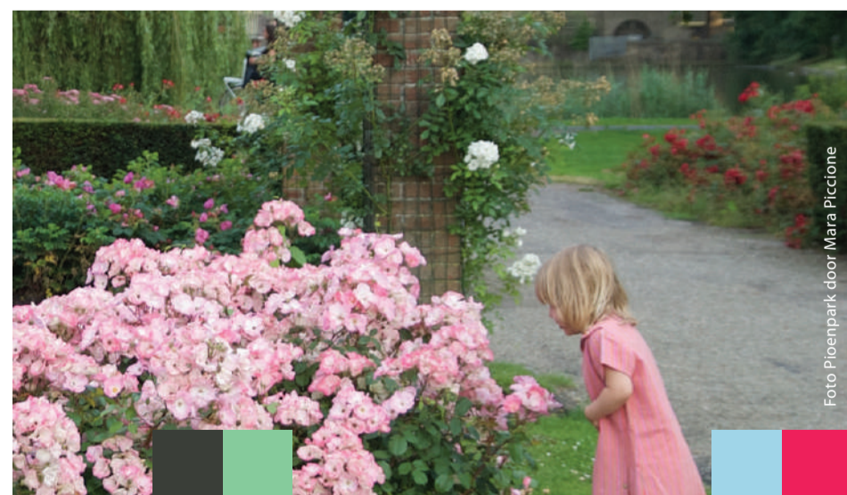
Foto Ploenpark