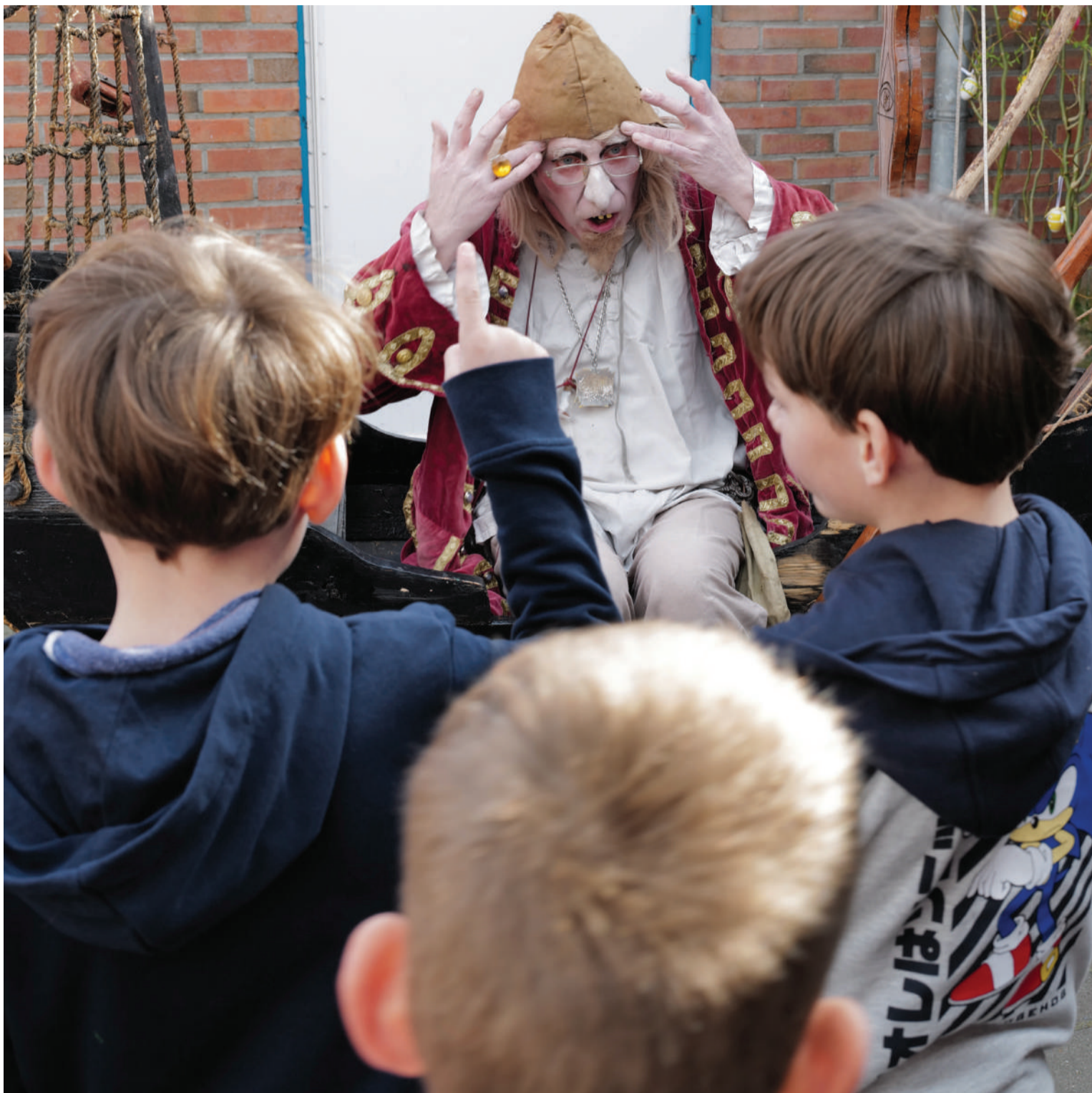
De kinderen genieten van El Capstok als De vliegende Hollander.

's Middags draaide het veel om kinderactiviteiten, waar ook de mama's en de papa's van genoten. De Shetlandpony's van Ponyverhuur Stadspark sjokten onvermoeibaar hun rondjes. Kinderen die voor een tweede of derde keer een ritje wilden maken: geen probleem hoor. Het was vertederend