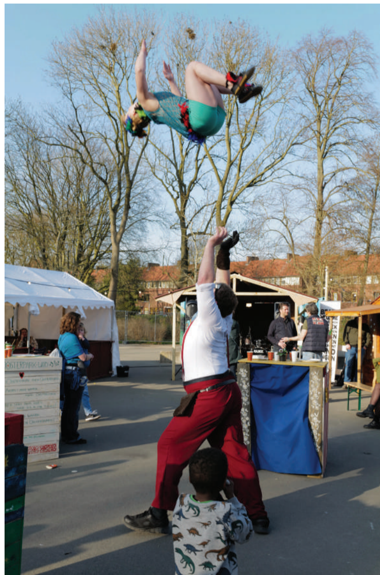
Het acrobatenduo No Nonsense.

Al met al was dit een fantastisch samenzijn met ongelooflijk veel mensen in mijn eigen wijk, waar ik steeds lopend naar toe kon, want vlakbij. Ik kan mij niet heugen, hoe ik ook mijn best doe, wanneer er ooit zo'n drukbezocht publieks-evenement heeft plaatsgevonden in de Oosterparkwijk! De organisatie heeft steeds tellingen per middag en avond verricht en kwam uit op een totaal van 2300 bezoekers!