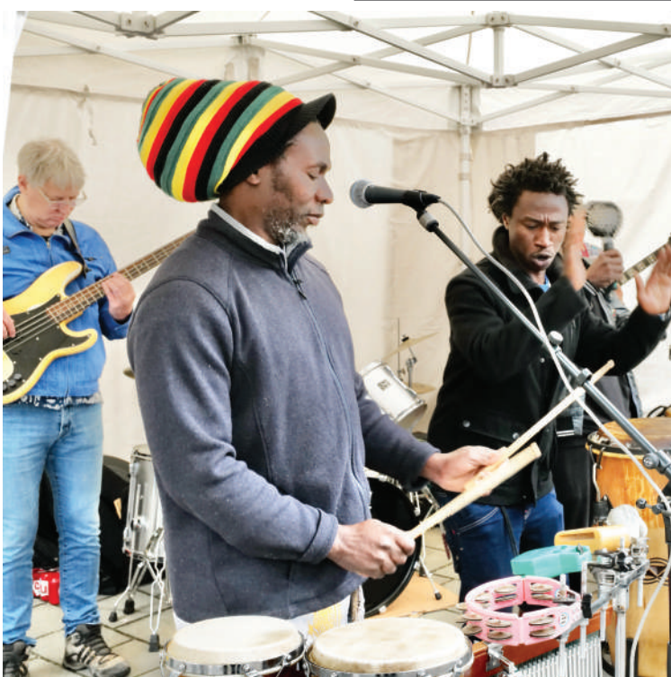
De band HELLO HELLO.