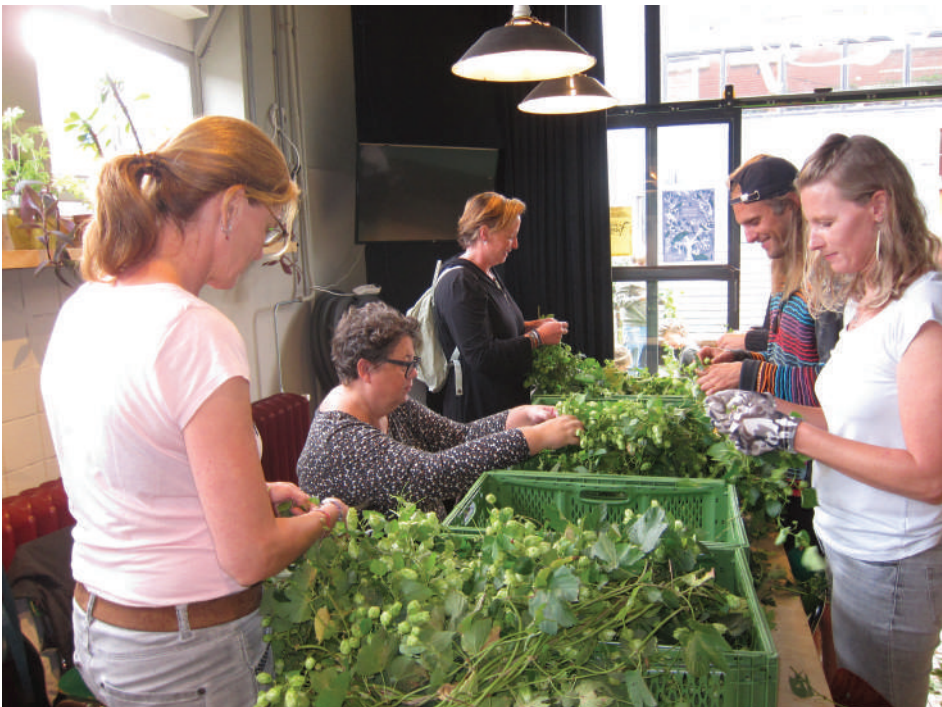
De hopbellen worden van de takken gehaald.

“In Toentje verbouwen we groentes en kruiden voor de voedselbank”, legde hij uit, terwijl hij geroutineerd een tak in drieën brak “Maar we telen ook hop – en die wordt nu geoogst. De takken die