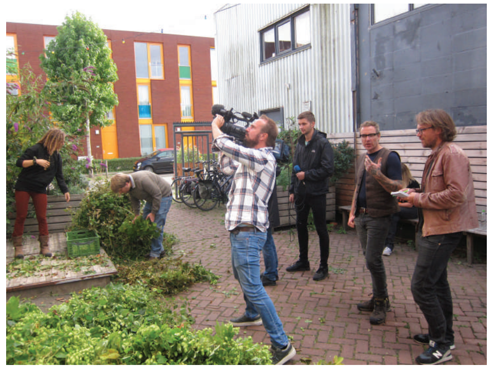
De hopoogst werd vastgelegd door journalisten.