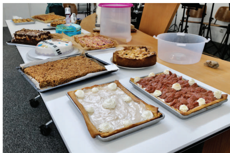
De taarten van de taartbakwedstrijd.

En de uitspraak die ik wel eens hoor: 'Het Leger des Heils is het afvoerputje van de samenleving' bevestigt bovenstaande woorden, hoe wrang en tegelijkertijd positief dit ook is. Alles bij elkaar verdient het Leger des Heils ons aller respect!