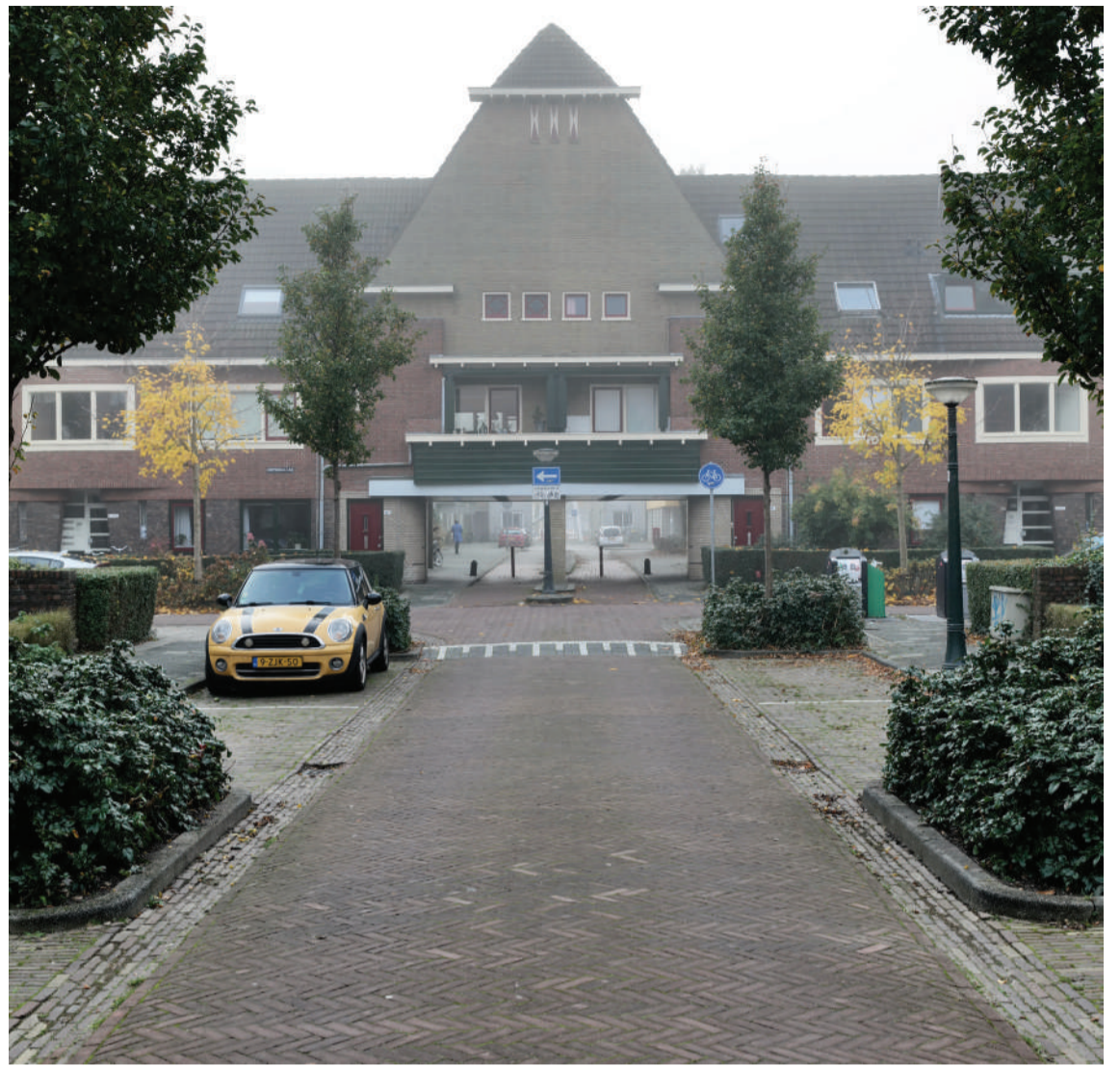
Door Frans Geubel

Het boek 'Endkampf om Groningen' kan telefonisch bij de schrijver besteld worden - tel.: 06-23501067 - of via een bestelformulier op de website sdwboeken.nl Ook is het verkrijgbaar bij boekhandel Godert Walter, Oude Ebbingestraat 53. Het kost 24 euro.