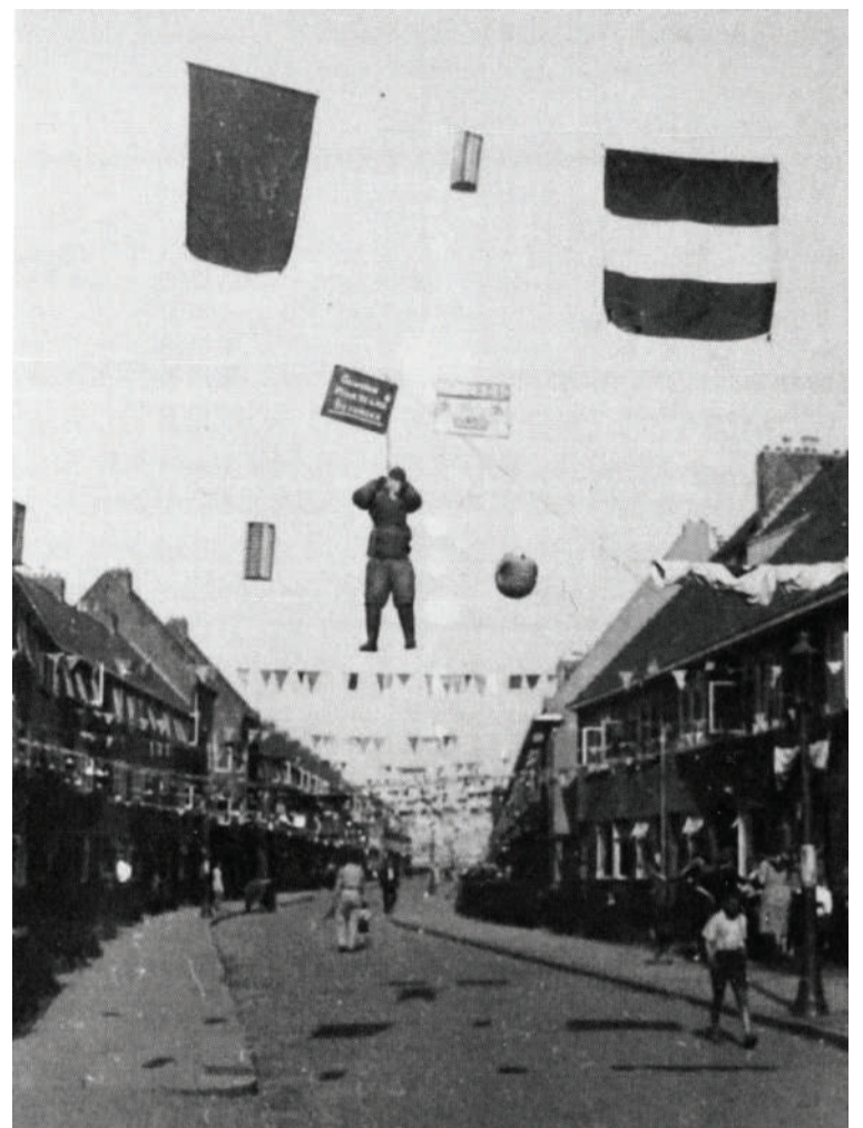
De versierde Irislaan tijdens de vele bevrijdingsfeesten. Tussen de vlaggen en lampions hebben de inwoners een pop gehangen met daarboven een bord waarop staat: ‘Gewogen maar te licht bevonden’. Ernaast een bord met als opschrift: ‘Zaterdag 10 (dan een niet te lezen maand met hakenkruizen) en het woord ‘vonnis’. De betekenis hiervan is niet helder. Mogelijk gaat het hier om een in de straat wonende NSB'er. Foto coll. Lukas Kwant. (Uit: Sipke de Wind - Endkampf om Groningen).

In tijgersluipgang kropen de Dijkema's naar de noordelijke brug, staken het water over, balancerend op een drijver – dat is een balk die dient ter bescherming van de kwetsbare sluisdeur – en renden aan de andere kant van de sluis naar de zuidelijke brug. Daar bevond zich de machinekamer. Ze tilden het metalen deksel op en daalden de ladder af naar beneden. Daar gingen ze aan het werk. Door met beide handen aan de tandwielen te draaien, lukte het hun de zuidelijke brug langzaam, heel langzaam te laten zakken. Om half zes was