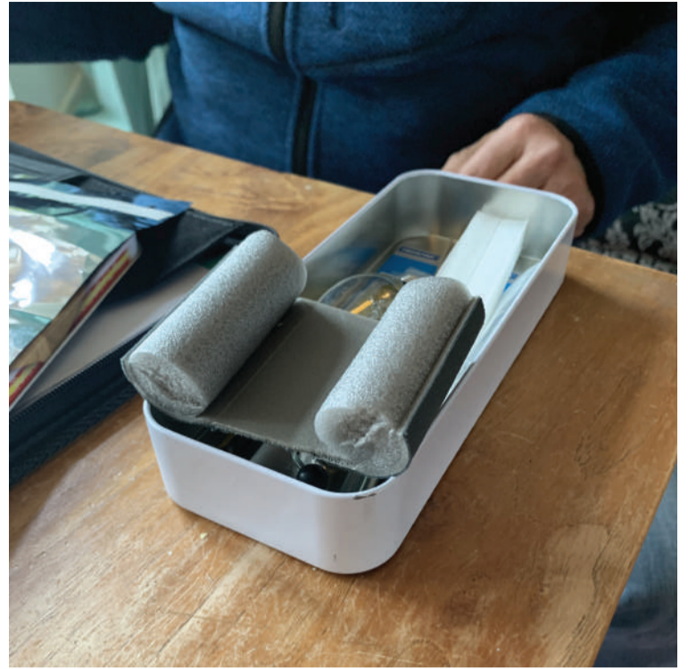
Voorbeelden van de isolatiemaatregelen: een simpele voorziening om de tocht onder de deur tegen te gaan.

We praten onderling nog na over omgaan met energie. Het lijkt vaak een discussie over geld, maar het is er ook een over comfort en natuurlijk een over milieu. Mag allemaal, en iedereen heeft dan een eigen verdeling in. De bewoners van hetzelfde huis zijn het vaak niet met elkaar eens. Het adviesgesprek wordt dan een discussie. Denk aan de diverse ruimten in het huis en aan kiezen wat warm moet en wat niet hoeft. Je kunt alle ruimtes apart instellen op temperatuur, bij het ontwerpen en kiezen van de cv, of zelfs bij het bouwen van het huis. Alleen de huiskamer warm, net als vroeger, dat zou wel mooi zijn. Maar dat vergt een mentaliteitsverandering die afwijkt van de luxe die we gewend zijn. Die luxe kost ons nu veel en gaat daarnaast ten koste van arme landen, want die kunnen de huidige hoge prijzen niet betalen. Een nieuw evenwicht is nodig, maar dan moeten wij in Nederland wat inleveren. Dat willen we niet zomaar en dat is goed te begrijpen. Teruggaan in comfort en luxe: dat gebeurt nu en we