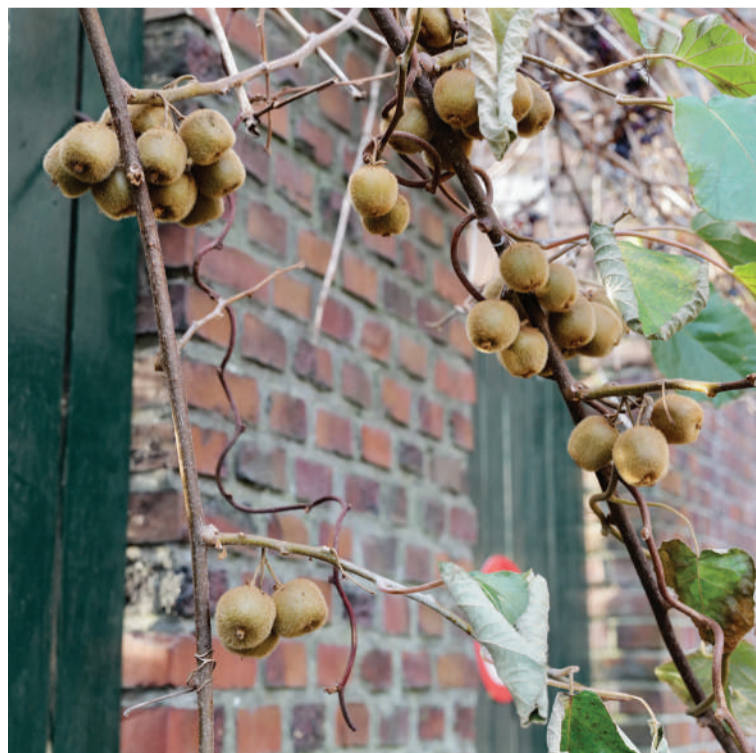
Kiwi's in de Zonnebloemstraat.

Ik plukte er eentje en schildte 'm voorzichtig: precies een groene kiwi, maar ongeveer één derde van het normale formaat. Hij smaakte ook zo, een beetje onrijp nog.