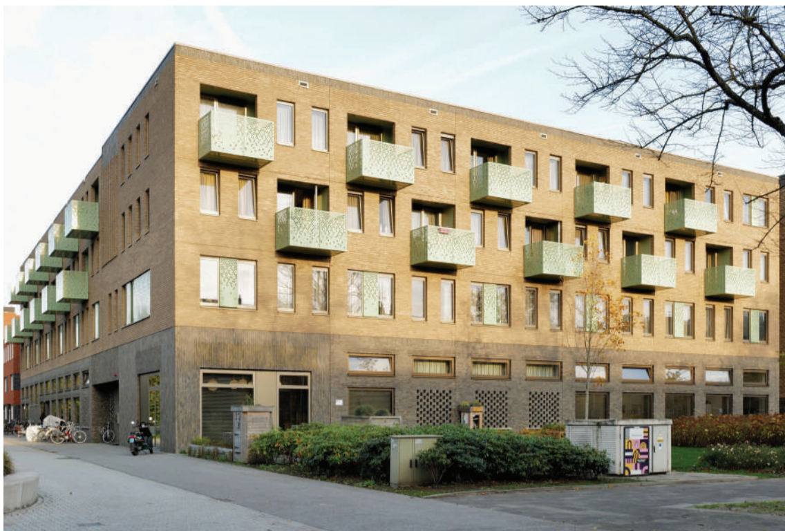
Wender: Hoek Piet Fransenlaan - Zaagmuldersweg.

Ik denk dat de meeste Oosterparkers het als een gewoon wooncomplex zien, en niet weten wat het in werkelijkheid is.