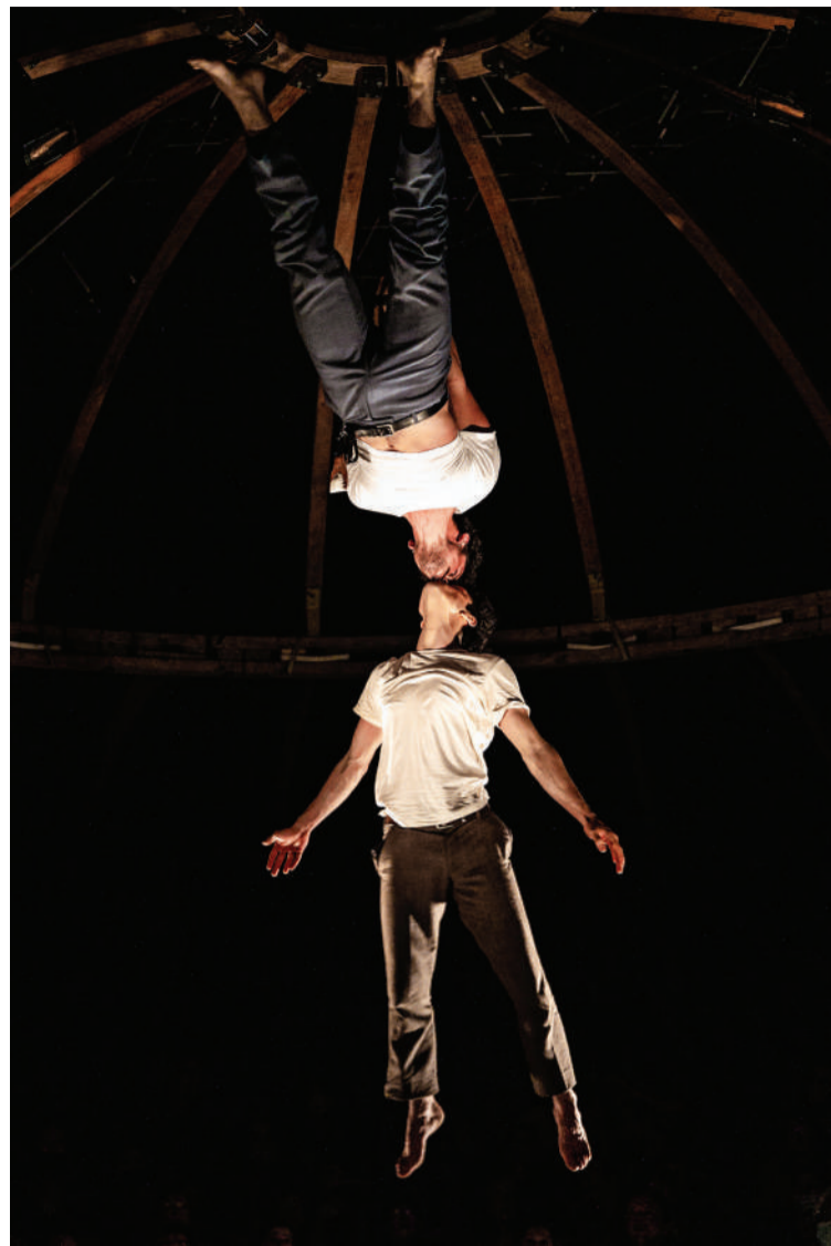
BITBYBIT in actie.