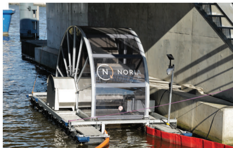
De CirCleaner onder de Berlagebrug.

In 2021 overleden 1.859 mensen door zelfdoding, dat zijn er gemiddeld 5 mensen per dag. Elke suicide raakt gemiddeld 135 mensen. Dit betekent dat er in 2021 meer dan 250.000 mensen geraakt werden door het verdriet van een zelfdoding. Er rust nog steeds een taboe op het praten over zelfdoding, en er is veel schaamte. Terwijl een gesprek nou juist enorm kan opluchten en het begin kan zijn van een oplossing. Iedereen kan zo'n gesprek voeren, het is spannend maar niet moeilijk. 113 heeft speciale trainingen om dit gesprek te leren voeren en hoopt dat via de '1K Z1E J3' bankjes campagne veel Nederlanders deze 'Eerste Hulp bij Suïcidale Gedachten' onder de knie krijgen.