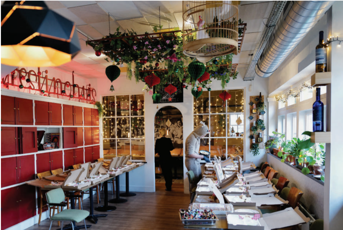
Door Erik Weersing