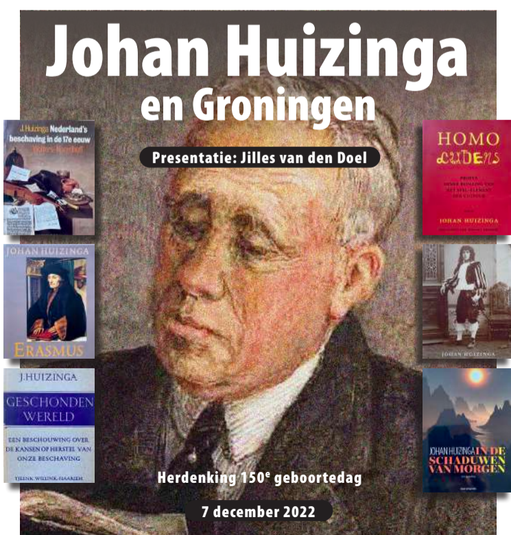
Het affiche van de lezing.