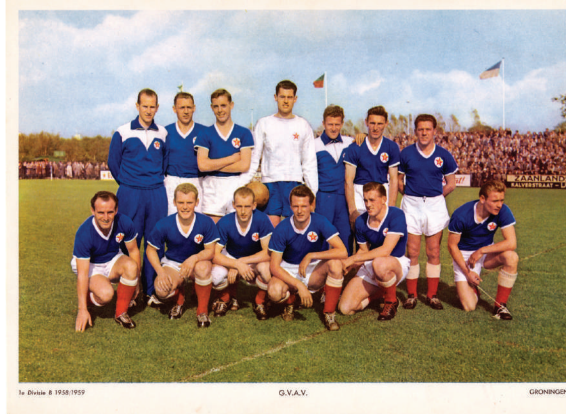
1e Divisie B 1958/1959