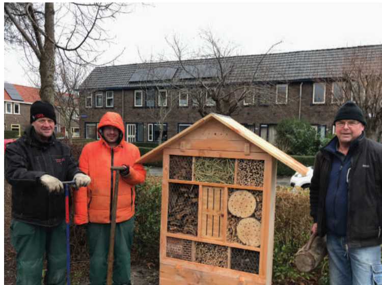
De mannen van Werkpro Driestenberg en ‘hun’ insectenhotel.