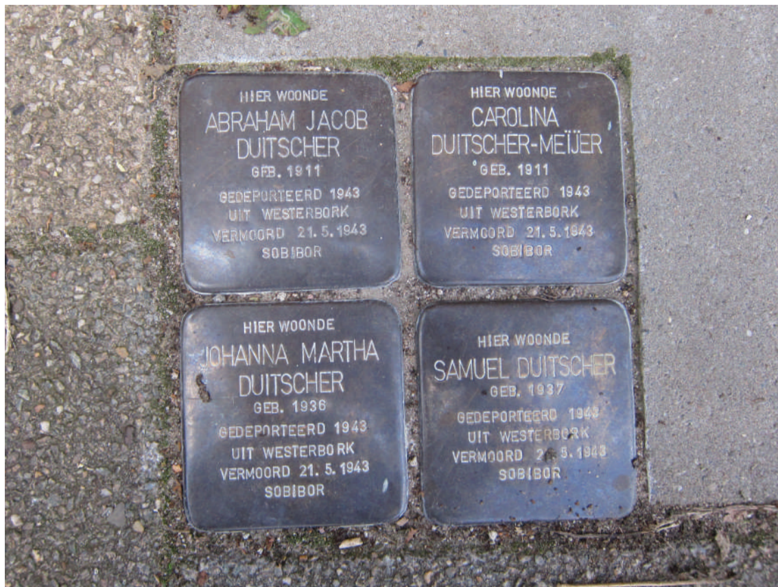
De Stolpersteine in de Jan Hissink Janssenstraat.