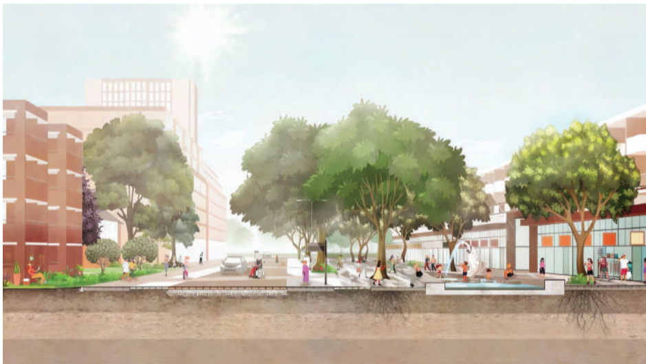
Een impressie van de Zonnelaan in Paddepoel.

aandragen. Na het gezamenlijk opgestelde plan wordt er een klankbordgroep geformeerd, die het ontwerp- en inrichtingsproces kritisch zal begeleiden. De klankbordgroep zal bestaan uit 15 inwoners, grotendeels bewoners van de Zaagmuldersweg. In oktober zal de klankbordgroep samen met de gemeente een wandeling maken door de straat, om eventueel nieuwe ideeën op te doen. Alle plannen worden aansluitend samengebracht in een eerste Schetsontwerp (SO). Na alle mitsen en maren wordt het SO omgewerkt tot Voorlopig Ontwerp (VO), dat weer de voorloper is van het Definitieve Ontwerp (DO). Tegen die tijd is het al december en praten we jullie bij over dit plan. Maar daarvoor uiteraard ook! Zie ook onze website en facebookpagina.