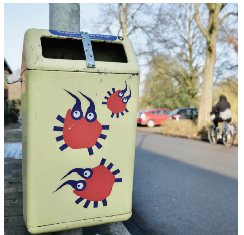
Afvalbak van Duurzaam Oosterpark.

gebruik de bakken voor kleine dingen. Hele vuilniszakken horen in de onderaardse containers.