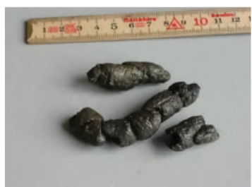
Zo herkent u de ontlasting van de steenmarter.

Ook bij het wijkcentrum hebben wij sporen van de steenmarter gevonden. In de kelder van het oude pand vinden we regelmatig ontlasting van de steenmarter. Die kelder gebruiken ze dus als een soort van latrine, want hun eigen nest bevuilden doen ze niet. Een andere aanwijzing dat er mogelijk steenmarters op zolder en de vlieringen actief zijn,