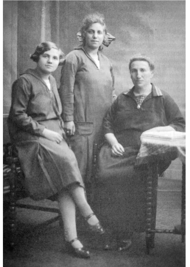
Foto ontleend aan het boek ‘Jaap en Ischa Meijer’ (2008) door Evelien Gans.