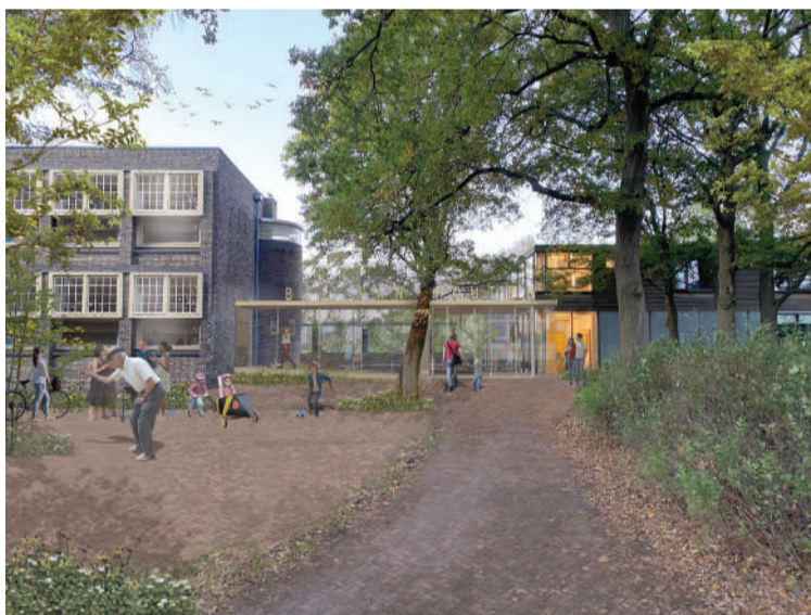
Toekomstige entree bij Van Houten (De Unie Architecten).

Ook alvast het vermelden waard: de manifestatie 'Ontdek bij Van Houten', op zaterdag 6 juli van 12 tot 16 uur.