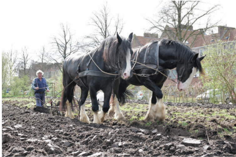
Twee sterke Shire paarden trekken de handploeg.