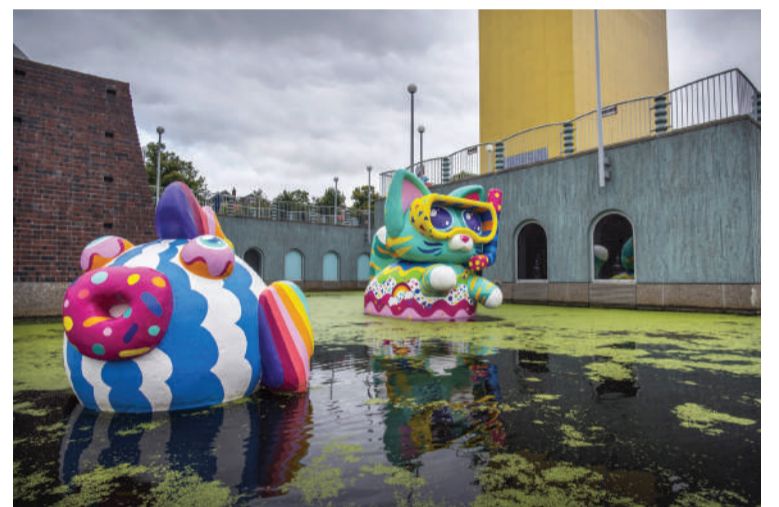
Badkat & Guppy zijn gemaakt door de kunstenaars Kwannie en Man-Yee van Studio Maky.

Om ook alvast in je agenda te zetten; Badkat & Guppy, voorzien van nieuwe zomerse jasjes worden op vrijdag 19 juli tussen 15.00 – 17.00 uur feestelijk te water gelaten in de Pioenvijver, zorg dus dat je daarbij bent!