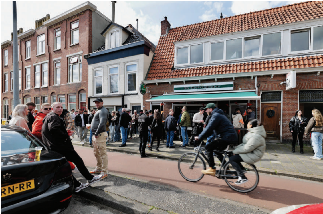
Gezellige drukte bij de opening op 27 april.