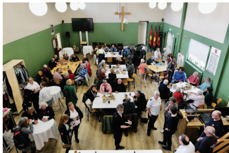
Een gezellig samenzijn in het kerkgebouw.