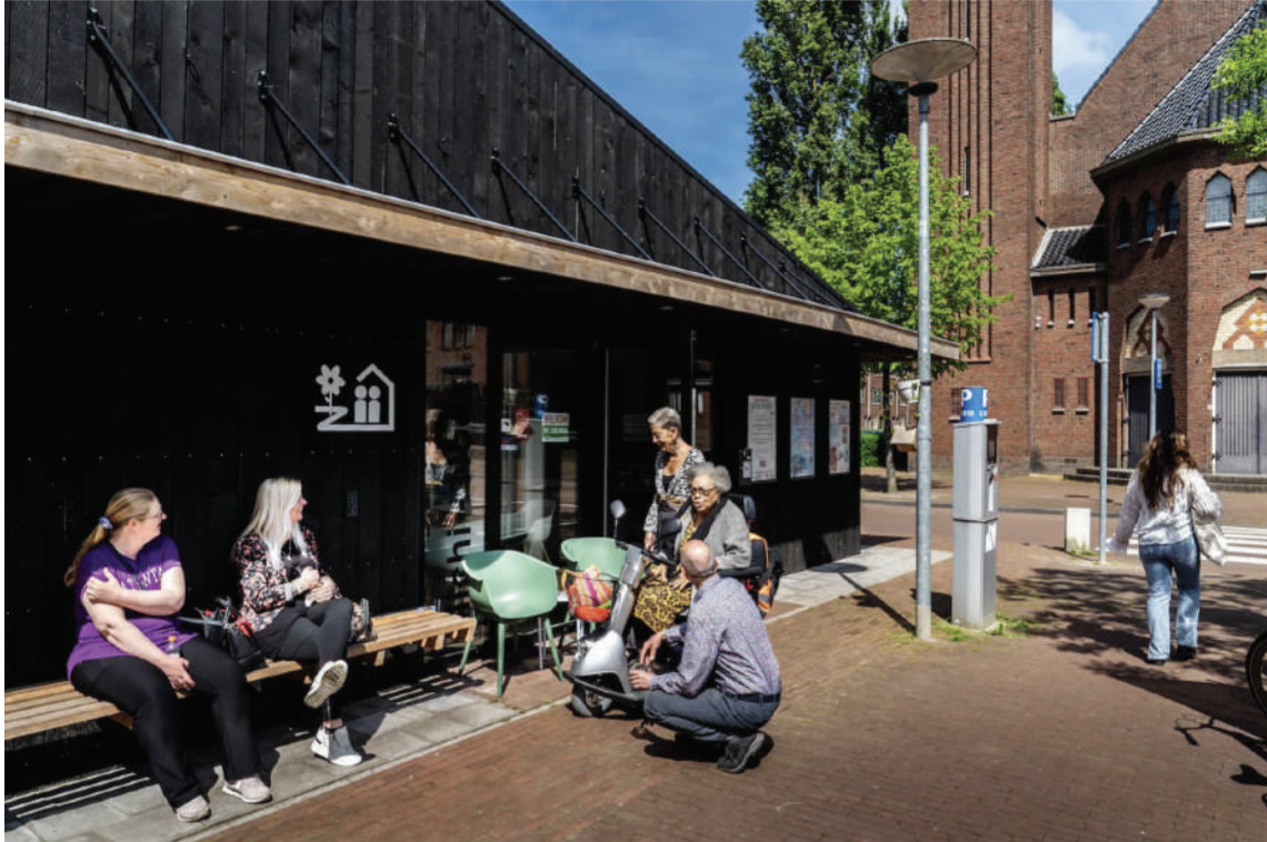
Bewoners kunnen elkaar en ook de wijkmanager ontmoeten bij het buurtpraathuis Michi-Noeki in de Oosterparkwijk.

In veel stadswijken stapelen de problemen zich op. Maar in de Groningse Oosterparkwijk, ooit het decor van rellen, gaat het juist bergopwaarts.