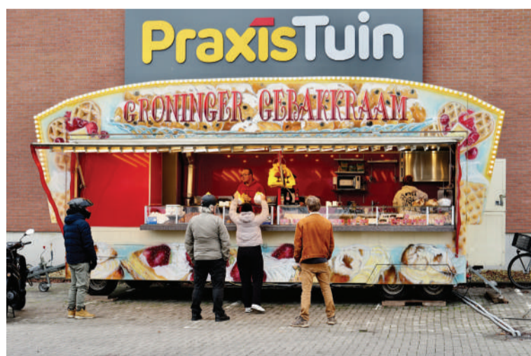
De oliebollenkraam bij de Praxis. Is elk jaar weer een begrip vanaf november.